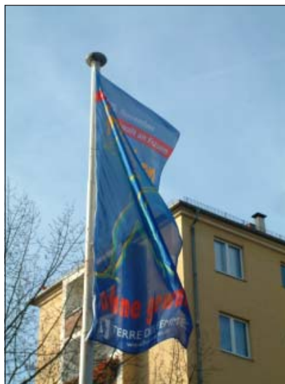
Aktionsfahne zum 25. November vor dem UCW.

mit der Evangelischen Akademie zu Berlin „Frauen kommen, aber wohin geht die Macht?!“ (2006) und „Wertschöpfung durch Vielfalt: Diversity – Unternehmenskultur der Zukunft“ (2007), jeweils auf Schwanenwerder. Beide markieren inhaltliche Schwerpunkte der Arbeit der vergangenen Jahre – den Themenkomplex „Frauen und Wirtschaft“ und die Beschäftigung mit dem Diversity-Prinzip. Im Ergebnis hat der LFR Berlin im Frühjahr 2008 die Charta der Vielfalt unterzeichnet. Über beide Seminare wurde in „Wir Berlinerinnen“ ausführlich berichtet, der Ausgabe im Dezember 2007 lag eine Dokumentation der Beiträge der